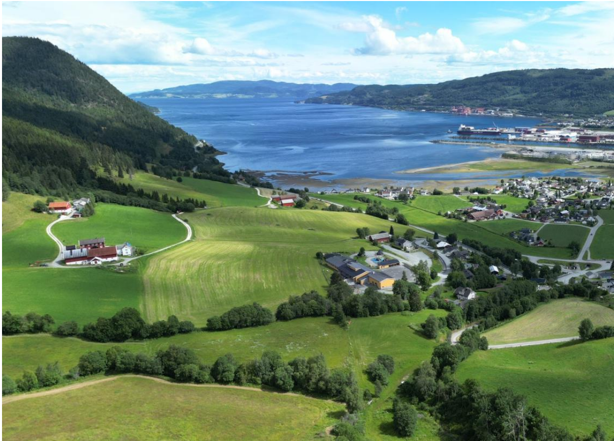
Figur 1: Orkland med landbruk, fjord, fjell, industri og by. Dronefoto fra Råbygda, kilde Orkland kommune