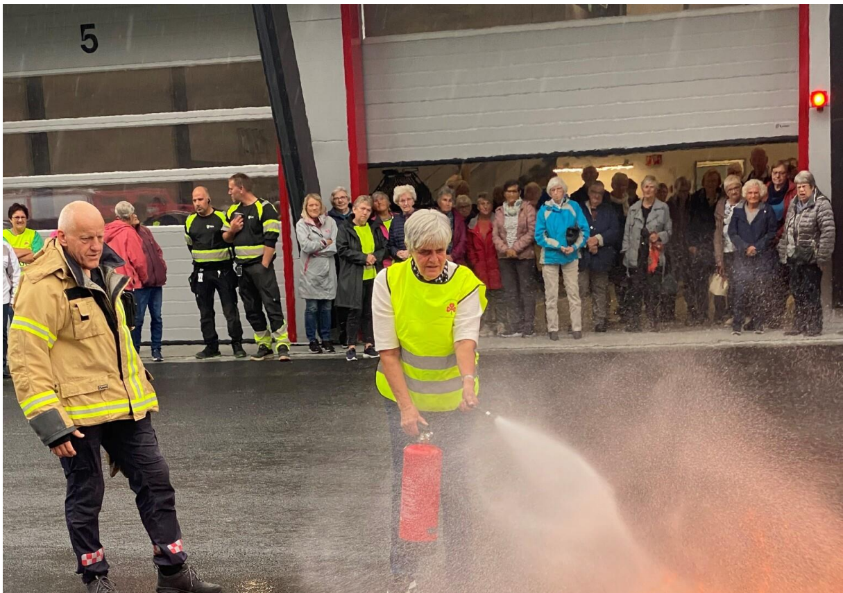
Deltakerne fikk prøvd brannslukkingsutstyr på forrige Trygghetstreff i september 2022.

Sanitetskvinnene og Orkland brann og redning ønsker igjen eldre til gratis hyggelig treff om brannvern. Det er bare å sette av torsdag 1. juni i kalenderen allerede nå.