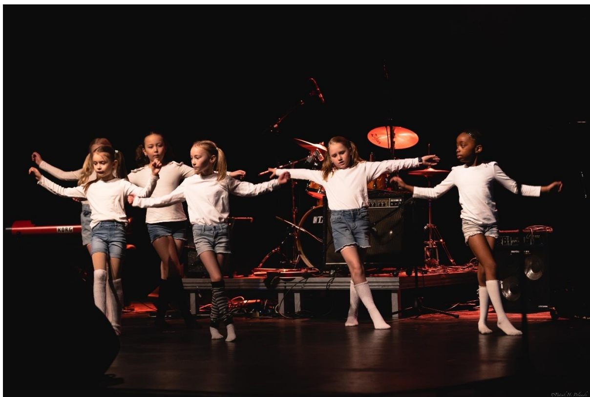
Fra arrangementet i 2022.

Med over 450 elevplasser og undervisning på de fleste skolene i kommunen, vil de mange elever få opptre i sitt nærmiljø.