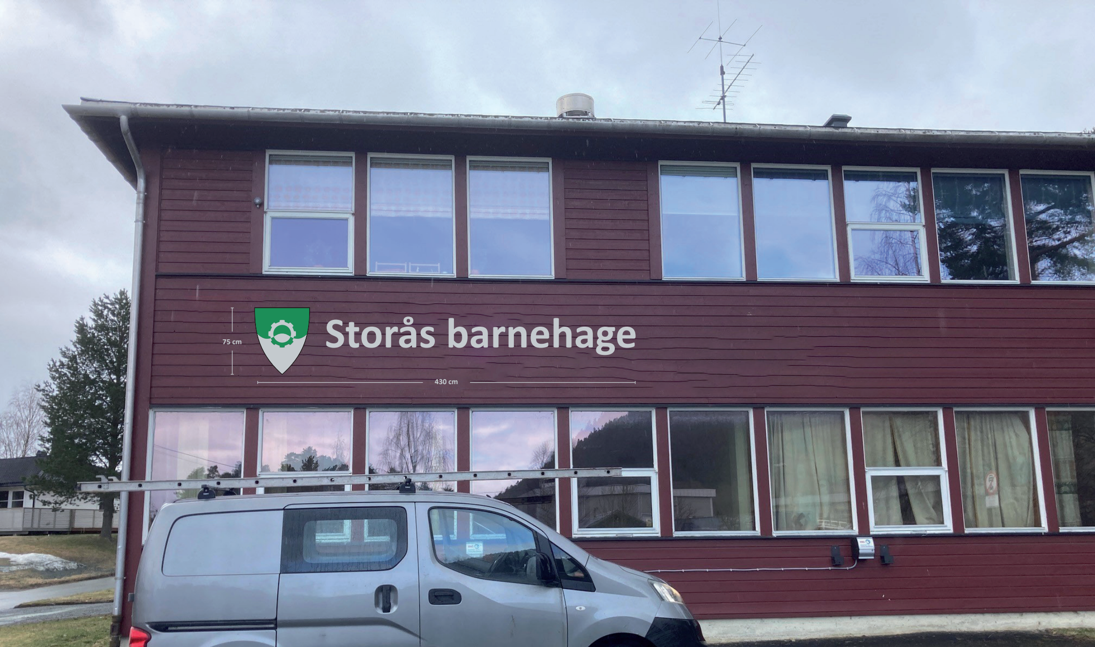
Eksempel på skilt på mørk vegg med tekst på ei linje