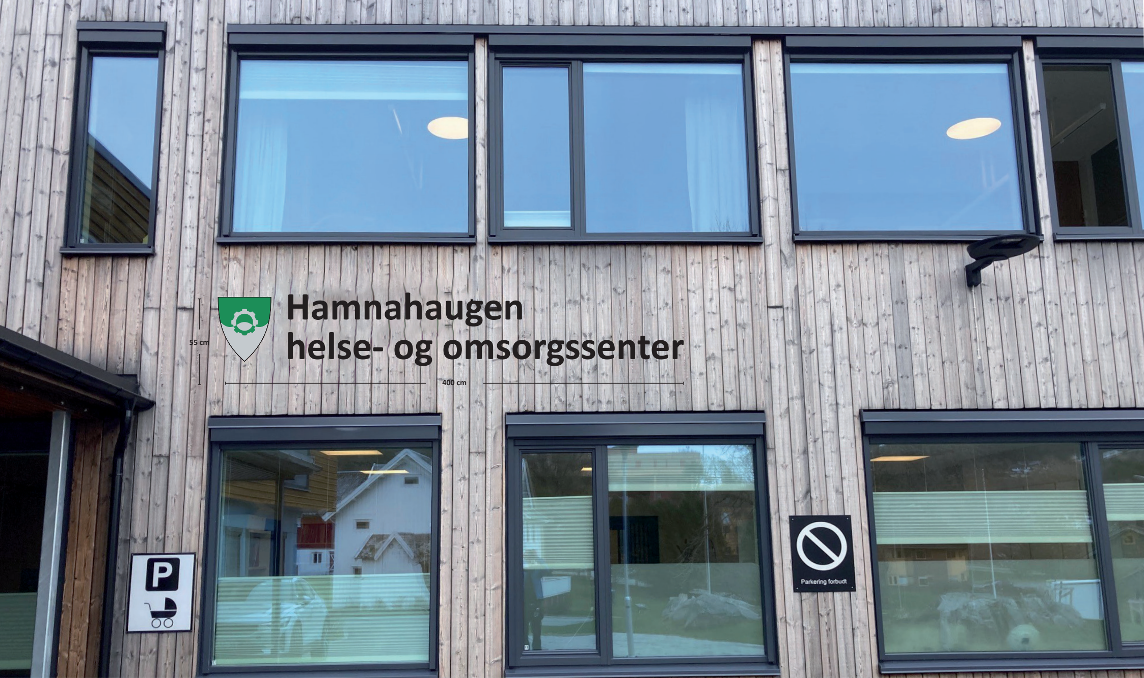
Eksempel på skilt på lys vegg med tekst på to linjer